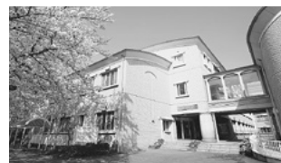
市立看護短大校舎

教員公募は10月より行い、奨学金については、卒業後の市内定着や優秀な学生の確保のため、授業料等の設定も踏まえ拡充を検討することが明らかになりました。