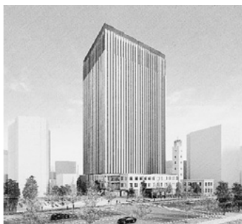
市役所本庁舎完成予想図

市は、「設計内容の変更によるコストダウンを図り、早期着工により完成までの民間ビルの賃貸借期間を短縮するなど財政負担の軽減に取り組みたい」と回答しました。